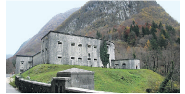
Die drei Jubiläums-Tourentipps kommen aus der Schweiz, Österreich und Slowenien