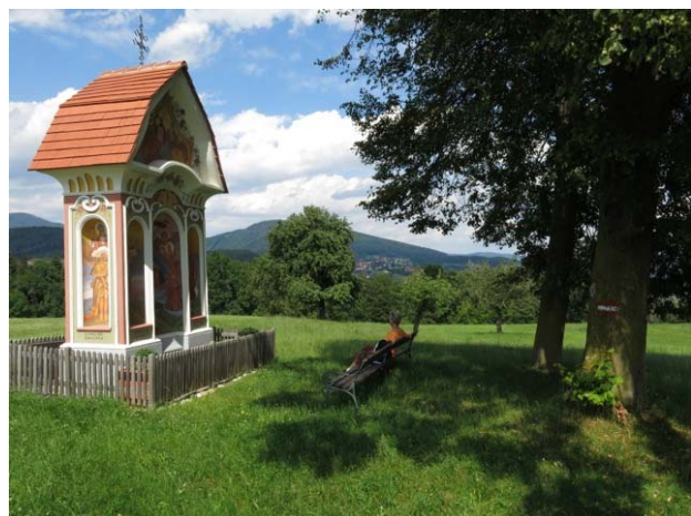
Der Bildstock in Göttelsberg.