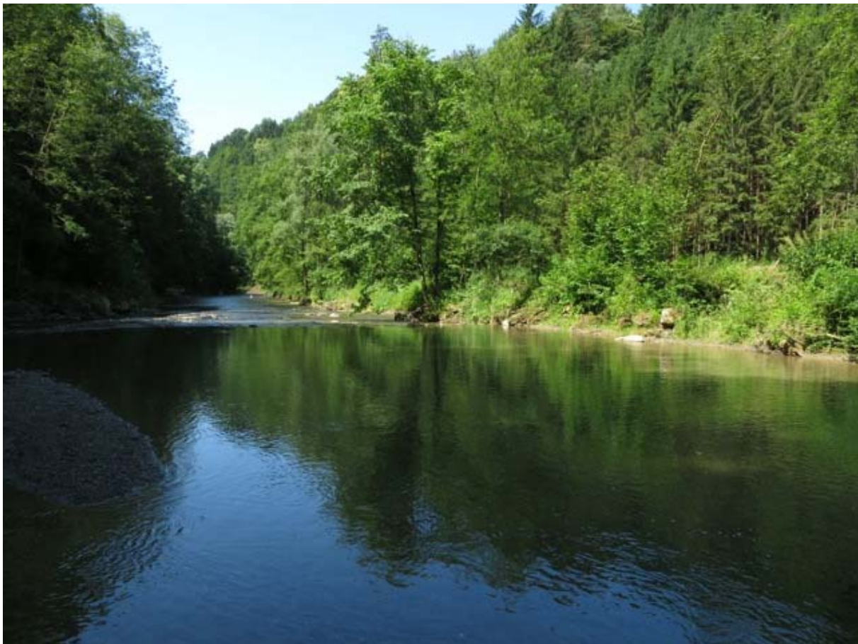
Die Raab, nahe der Wünschbachbrücke.