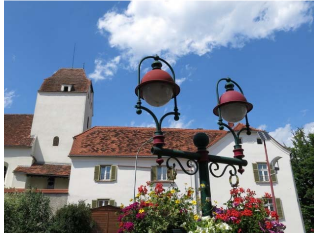
Der Weizer Hauptplatz mit der Taborkirche.