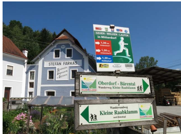
Die Farkas-Mühle in Oberdorf.