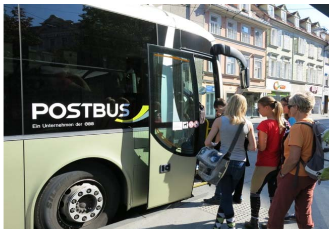
Bequem geht's mitten im Grazer Stadtzentrum los.

Das Besondere. Die Wanderstrecke liegt im Naturpark Almenland, ist vorbildhaft beschildert, lässt sich einfach begehen und erweist sich als ein ideales Ziel für „Ausflüge mit Kind und Kegel“ nahe am Wasser. Speziell Familien und familiäre Gruppen erfreuen sich riesig an der Kleinen Raabklamm.