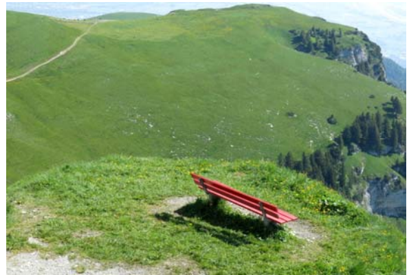
Appenzeller Bänkli auf dem Hohen Kasten.