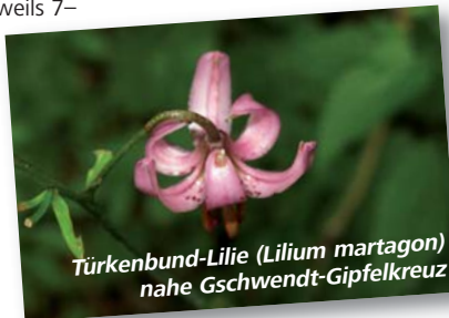
Türkenbund-Lilie (Lilium martagon) nahe Gschwendt-Gipfelkreuz

Mobil Zentral, Graz, Jakoministraße 1 Auskünfte, Beratung, Buchungen, Fahrkartenverkauf sowie Ausgabe von Wanderfoldern und Freizeitbroschüren Öffnungszeiten: Mo bis Fr jeweils 8–18 Uhr, samstags 9–13 Uhr Telefondienst: Mo bis Fr jeweils 7–19 Uhr, samstags 9–13 Uhr Tel. 050 6 7 8 9 10 (im Festnetz zum Ortstarif) E-Mail: service@mobilzentral.at BusBahnBim-Auskunft | www.verbundlinie.at