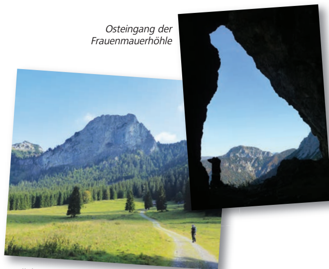
Osteingang der Frauenmauerhöhle

Heute kann die Frauenmauerhöhle gefahrlos von Bergwanderern besucht werden. Das ist den Eisenerzer Höhlenführern zu verdanken, die im Zeitraum zwischen Mitte Juni und Mitte September an Wochenenden vier Mal täglich (2x vom Westen und 2x vom Osten) Höhlenführungen anbieten. Wir wollen dieses Angebot nutzen und die Frauenmauerhöhle von West nach Ost durchsteigen; Ausgangspunkt dafür ist die Gsollkehre zwischen Präbichl und Eisenerz; Endpunkt der Präbichl selbst, den wir vom Frauenmauer-